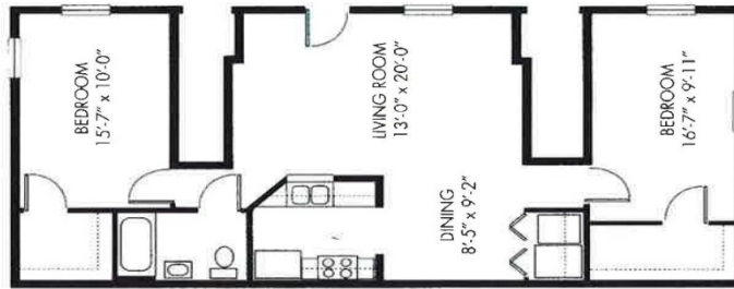
TWO BEDROOM FLAT FIRST FLOOR ONLY