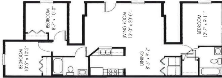
THREE BEDROOM FLAT FIRST FLOOR ONLY