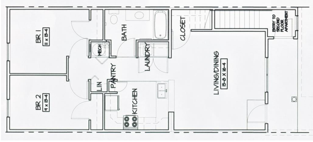
Two Bedroom Unit Layout